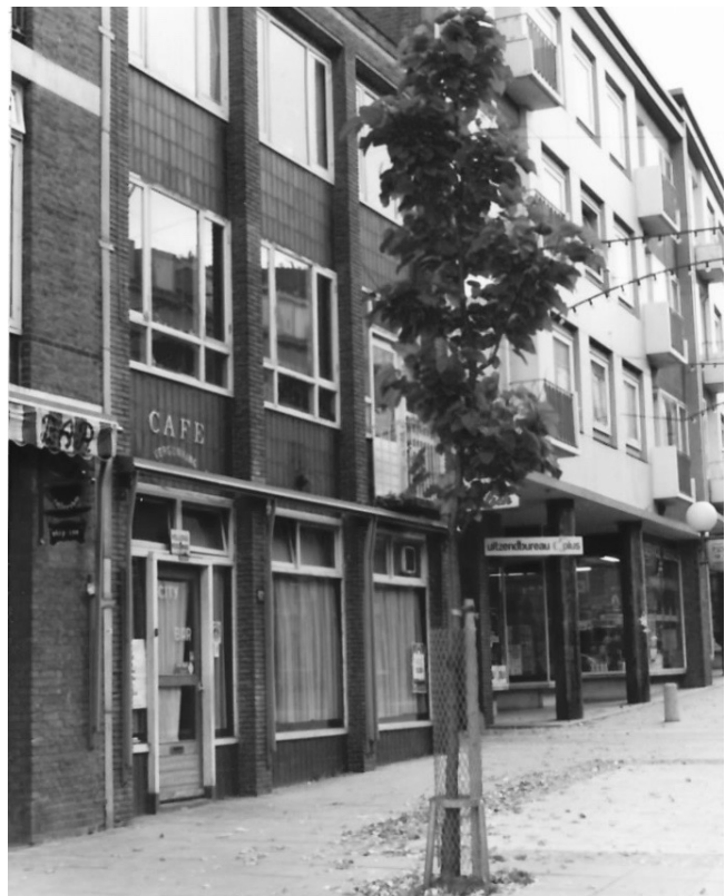
City Bar, onderaan de Houtstraat