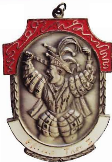
In de archieven is geen prinsenfoto van Theo I te vinden. Zijn fraaie Prinsenorde is wel bewaard.

Graodus van Nijmegen is stil geworden. Het licht van Theo Eikmans is gedoofd. Stilte maar ook licht om in de clown Graodus de mens Theo te zien. Stilte om in gedachten te luisteren naar zijn mooie stem, zijn onnavolgbaar timbre, en licht om te kijken naar zijn getekend gezicht en doorgroefd gelaat. Stilte om te genieten van zijn onvergankelijke woorden, zijn onmiskenbare humor, en licht om zijn glinsterende en guitige ogen voor de geest te halen. Stilte om na te denken over zijn wijze raad, en licht om 'Lang leve de lol' te zingen. Stilte, maar ook licht. Gekruiste tegenstellingen, die terugkeren in de woorden dichtbij en veraf. Graodus fan Nimwegen was soms veraf, een onaantastbare grootheid waar niemand aan kon tippen. Maar Theo Eikmans was dichtbij, wanneer hij na zijn optreden met Lies en vrienden wat biertjes dronk. Ex-prins Theo I was veraf wanneer die ander zich de jaren herinnerde, waarin Graodus successen beleefde, ver voor de tijd dat zijn