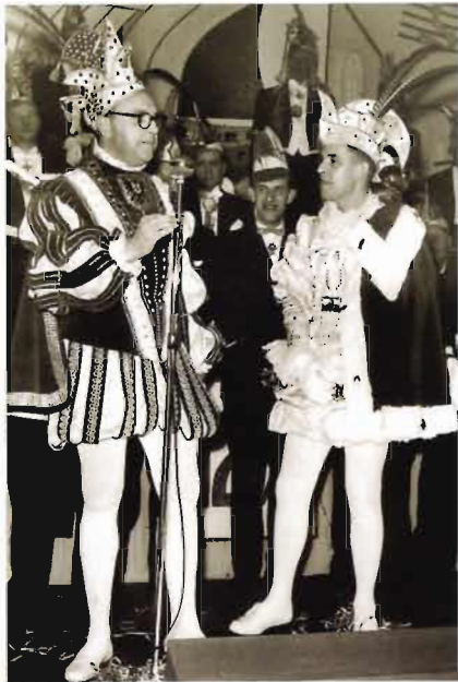
Prins Hans I wijst een kleinere Prins van Elders de weg in het wat grotere Nijmegen. Knotsburg bestond nog niet.