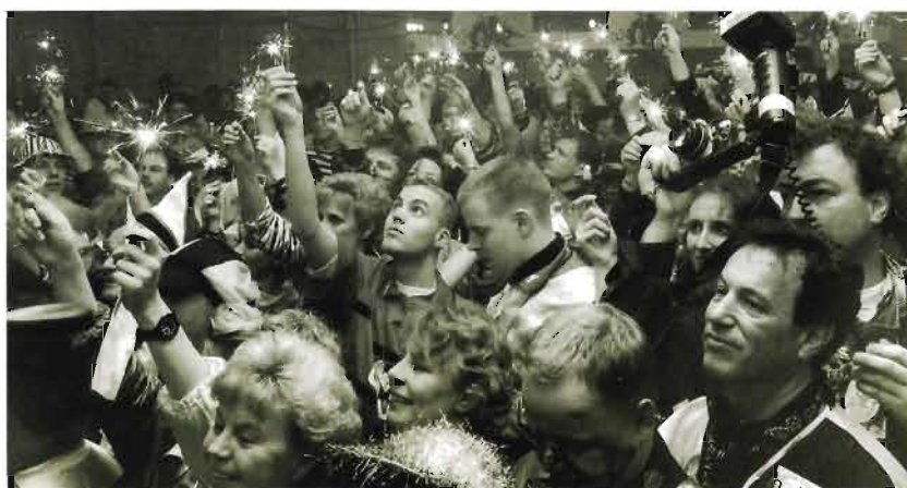
Sterretjes in de Hostent: dat komt nooit meer terug

We hebben genoten van de mooie bezoeken die we mochten brengen bij de diverse carnavalsactiviteiten. In het bijzonder gold dat voor de vier dolle dagen, met als hoogtepunten de sleuteloverdracht op het Stadhuis en de optocht door Knotsenburg. Nog twee andere momenten wil ik noemen, omdat die momenten de meeste indruk hebben gemaakt op mij en mijn kabinet. Op de eerste plaats de prinsenproclamatie: opkomen in een schitterende lasershow met kippenvel trekkende muziek en de toejuichingen door een fantastisch publiek in een bomvolle zaal van De Vereniging. Dat is iets, wat je nooit meer vergeet. Evenzo de ontluistering in een met carnavalisten volgepakte Hostent, die ondanks het enorme feest wat daar gevierd werd, aandacht had voor ons afscheidswoord. Er werd met sterretjes gezwaaid en meegezongen met het refrein van ons afscheidslied: 'En dan weet je, dat komt nooit meer, dat komt nooit, nee nooit meer terug'. Dan krijg je echt koude rillingen.