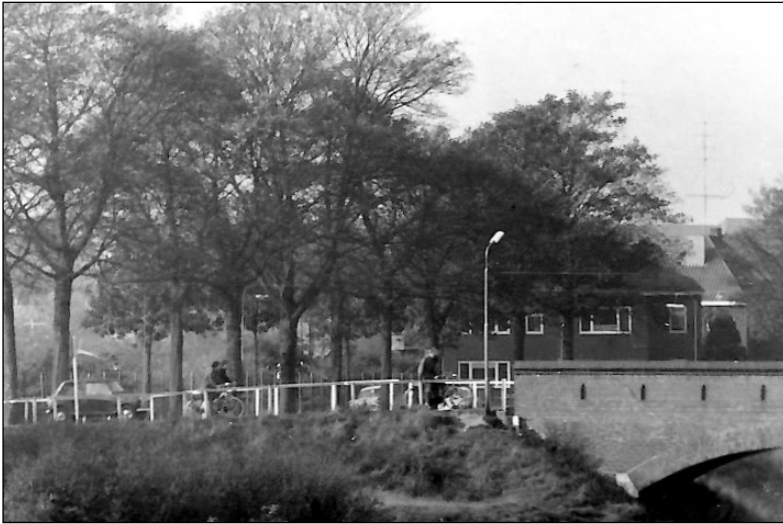
Zuidelijke oprit van bruggetje in de Driehuizerweg; op de achtergrond de huizen, die nu naast het HAN-complex staan

Eucharistievieringen plaats vonden. Dat hebben wij overigens niet meegemaakt. Later was het een oefengebouw voor de brandweer van Wis en Natuurkunde.