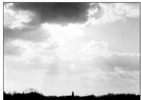
Uitzicht Jan Willem Passtraat 153