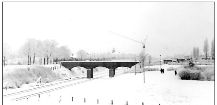
Boerderijen aan de Valkenburgseweg, vlakbij de spoorovergang in de Valkenburgseweg